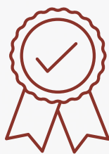
CERTIFICADO DE PARTICIPAÇÃO DIGITAL