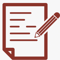
MATERIAIS DE APOIO

Nossos cursos oferecem uma experiência completa. Invista no seu futuro com benefícios e vantagens que fazem a diferença na sua jornada de aprendizado!