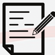
MATERIAL DE APOIO PERSONALIZADO