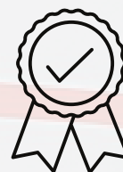
CERTIFICADO DE PARTICIPAÇÃO DIGITAL